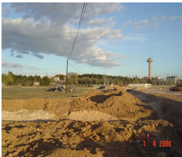
figura de Agente Urbanizador, Proyectos de Urbanización, Proyectos Reparcelatorios, Expedientes en el Registro de Propiedad, Expropiaciones, Redacción, Dirección y Gestión de Proyectos, obras y construcciones, Licencias y Tramitaciones ante Administraciones Locales, y Autonómicas, Expedientes sancionadores, etc.

Así UrbaPYME, entre otras, presta sus servicios directamente y en colaboración con los mejores técnicos para la transformación jurídica, técnica y material del suelo, y la gestión y desarrollo de productos inmobiliarios, entre otros: Planes de Ordenación Urbana, Planes Parciales y Especiales, Modificación de Planeamiento, Programas de actuación urbanizadora (PAU); Gestión Indirecta a través de la